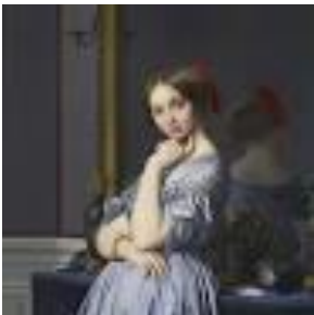
Fig.3: Ingres, Comtesse d'Haussonville, 1845, Frick Collection, Nova Iorque