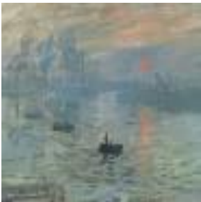
Fig.4 Claude Monet, Impressão, Sol Nascente, 1872, Museu Marmottan- Monet, Paris

O século XVIII deu início a uma enorme rutura com a tradição e os filósofos das Luzes foram os grandes responsáveis pelas novas maneiras de ver, sentir e pensar o mundo. As grandes transformações que se anunciam ao longo do século XVIII começam a materializar-se no século seguinte. A Revolução Francesa destruiu as hierarquias de um longo passado que se caracterizava por uma estabilidade que agora, a nova sociedade em constante renovação vai substituir por inovações, cujo reflexo nas artes iremos analisar ao longo desta sessão. A sessão terminará com uma visita no Museu onde iremos observar obras do período.