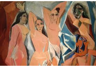
Fig.6: Picasso, As meninas de Avignon, 1907, MOMA, Nova Iorque