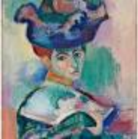
Fig.5: Henri Matisse, Mulher com Chapéu, 1905, San Francisco Museum of Modern Art, São Francisco