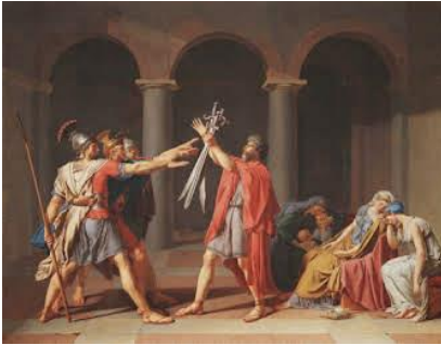
Fig.2: Jacques-Louis David, O Juramento dos Horácios, 1784, Museu do Louvre, Paris