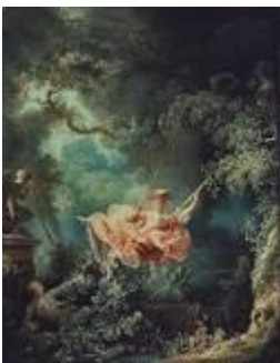
Fig.1: Jean-Honoré Fragonard, O Baloço, 1766, Wallace Collection, Londres

O Barroco e o Classicismo surgidos no século XVII vão continuar a marcar o século XVIII. A sensibilidade barroca, que exploramos na última sessão do 2º módulo, evolui para um gosto pelo requinte e pelo preciosismo (Rococó). Nesta época de enormes transformações, a religião deixa de ser o centro das atividades quer artísticas, quer literárias e, vemos surgir na pintura uma grande variedade de temas profanos como retratos, paisagens, temas do quotidiano, naturezas mortas e mesmo temas mais frívolos, testemunhando todos eles de uma nova sensibilidade e maneira de ver o mundo. Na 2ª metade do século surge em França uma reação clássica, o neoclassicismo, que vai, posteriormente, irradiar por toda a Europa. A sessão terminará com uma visita no Museu onde iremos observar obras do período.